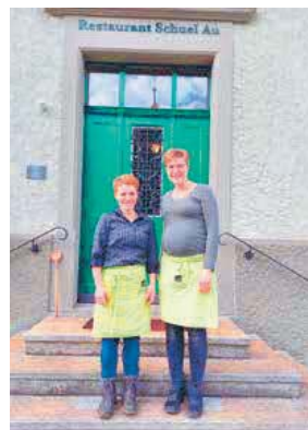
Die Nachfolge des Restaurant Schuelhaus Au ist geregelt – der Betrieb kann erfolgreich weitergehen.